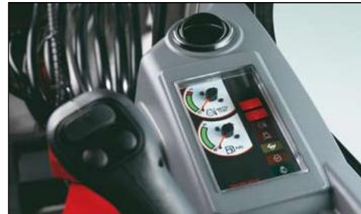
Armaturenbrett mit hör- und lesbaren Warnungen im Falle einer Störung während des Betriebes