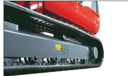
Laufrollen mit Innen- und Aussenführung für sicheren Gummikettenlauf und Double-Short-Pitch Gummiketten für vibrationsarmes Fahren