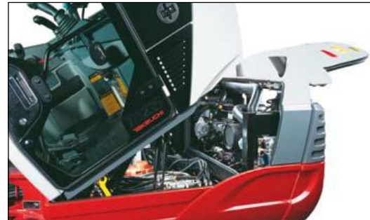
Kippbare Kabine mit servicefreundlichem Zugang zum Motor und den Hydraulikaggregaten