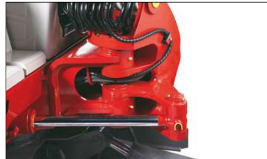
Robuster Schwenkbock mit besonders geschützter Schlauchführung und hydraulischer Seitenversetzung mit Büchsen in allen Positionen