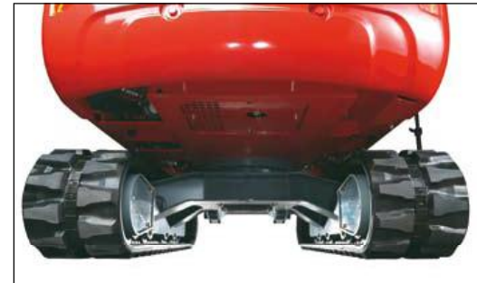
Grosse Bodenfreiheit, besonders geschützter Ober- und Unterwagen