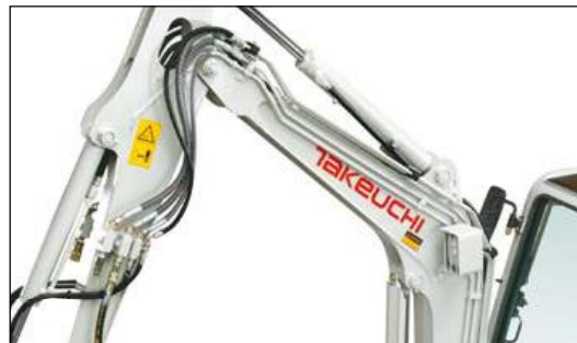
3 Hydrauliksteuerkreise serienmässig für eine Vielzahl von Anbaugeräten (1. und 2. Steuerkreis proportional gesteuert) Optional mit 4. hydraulischen Steuerkreis