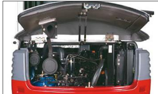
Abgas- und lärmreduzierte Motorengeneration, geräumiger Motorraum, Auspuffauslass nach oben; massives Gegengewicht