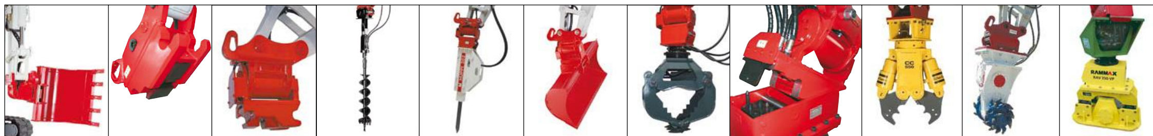
Powertilt mit hydr. Schnellwechselplatte, Tieflöffel als Hochlöffel montiert