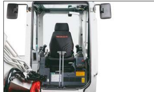
Schallgedämpfte, vibrationsarme Komfortkabine mit Luxussitz (wetterfeste Ausführung bei Modellen mit Überrollbügel) für ermüdungsfreies Arbeiten