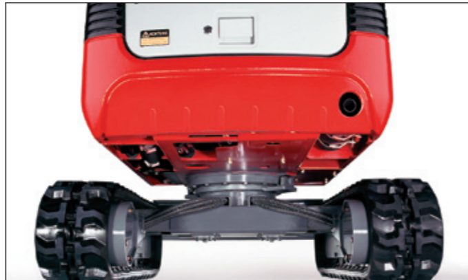
Grosse Bodenfreiheit, hydraulische Spurverbreiterung, geschlossener und daher besonders geschützter Unterwagen