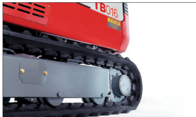
Laufrollen mit Innen- und Außenführung für sicheren Gummikettenlauf und Double-Short-Pitch Gummiketten für vibrationsarmes Fahren