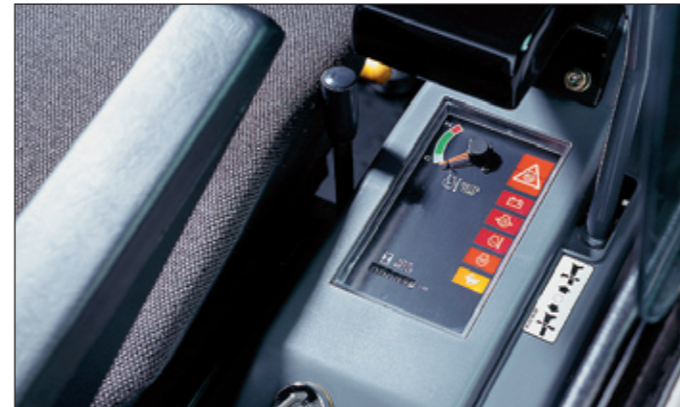
Übersichtliches Armaturenbrett mit hör- und lesbaren Warnungen im Falle einer Störung während des Betriebes