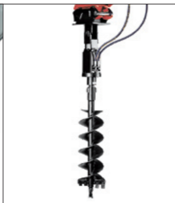
Erdbohrer mit Bohrschnecke