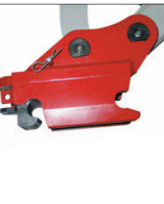
Mechanische Schnellwechselplatte BOT (optional mit Powertilt Schwenvorrichtung)