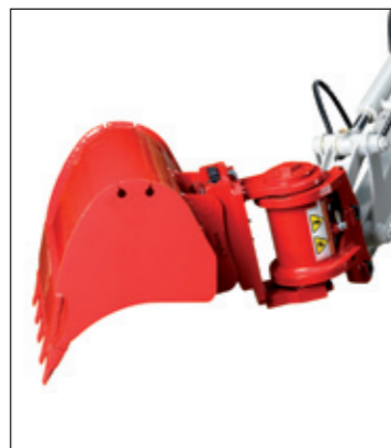
Powertilt mit mech. Schnellwechselplatte (BOT) (Tieföffel auch als Hochöffel verwendbar)