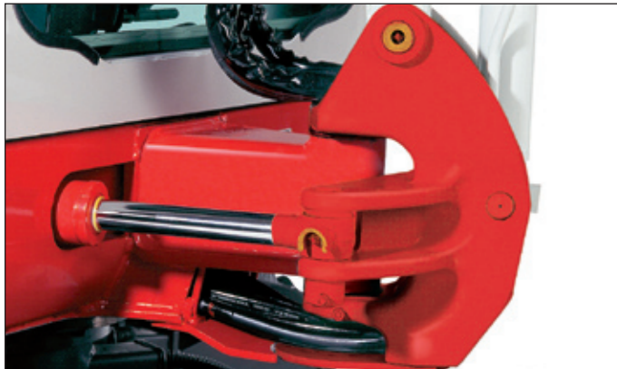
Robuster Schwenkbock mit besonders geschützter Schlauchführung und hydraulischer Seitenversetzung