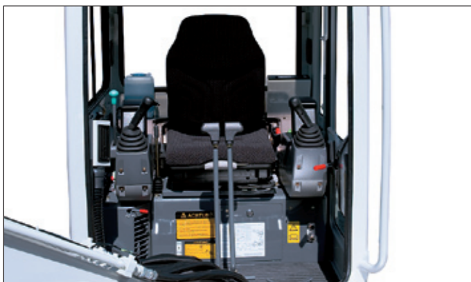
Schallgedämpfte vibrationsarme Komfortkabine mit Luxussitz (wetterfeste Ausführung bei Modellen mit Überrollbügel) für ermüdungsfreies Arbeiten