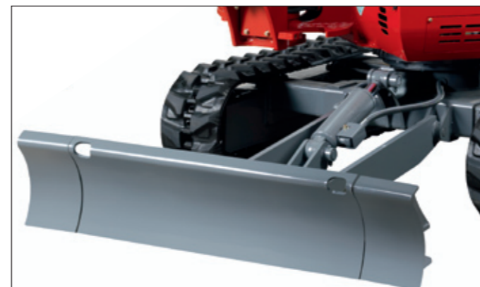
Weit nach vorne gezogenes Planierschild aus verwindungsfreiem Stahl