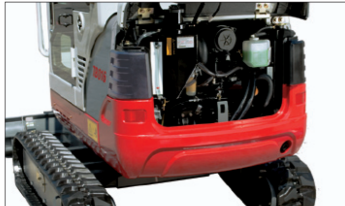
Abgas- u. lärmreduzierte Motorenserie mit doppeltem Luftfilter und geräumigem Motorraum; seitlich hochgezogenes Kontergewicht zum Schutz der gesamten Heckpartie