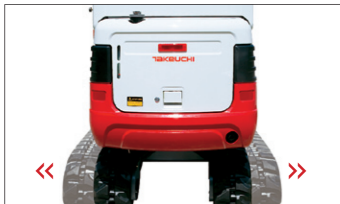
Raupenfahrwerk mit hydraulischer Spurverbreiterung